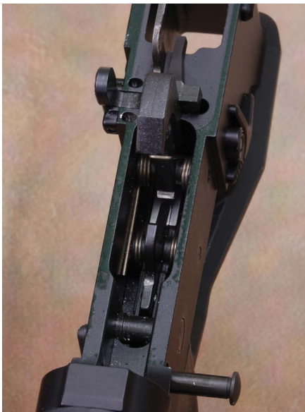
Der standardmäßige Direktabzug war von Hause aus sehr gut einjustiert und löste nach Überwindung eines Gewichts von 2.300 Gramm sauber aus.

Der kurze 10"/254-mm-Matchlauf mit 1-10"-Drall und 5/8"x24 UNEF-Mündungsgewinde wird von einem freischwingenden, formschönen Leichtmetall-Handschutz umkleidet, der gesetzeskonform weitestgehend geschlossen ist. In Punkto Stabilität ging HERA Arms auf Nummer sicher. Der Handschutz wird nicht nur mittels einer Klemmverbindung an der Laufbefestigungsmutter („barrel nut“) befestigt, sondern man setzt auch noch zwei Stiftschrauben auf beiden Seiten ein, die ein etwaiges Verrutschen verhindern sollen.