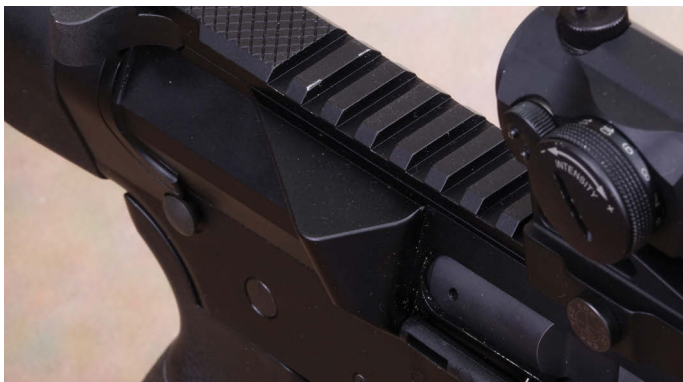
Der massive Hülsenabweiser am Systemgehäuse ist auf die 9 mm Luger abgestimmt.