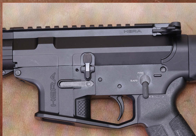
Griffstück und Systemkasten aus eigener Fertigung weisen viele eigenständige Konstruktionsdetails und Designmerkmale auf.