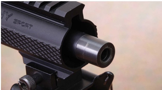
Der kurze 10"-Matchlauf mit Gewinde und Abdeckhülse. Es steht übrigens auch ein HERA Arms Karabiner mit ausgewachsenem 16,75"-Lauf zur Auswahl.