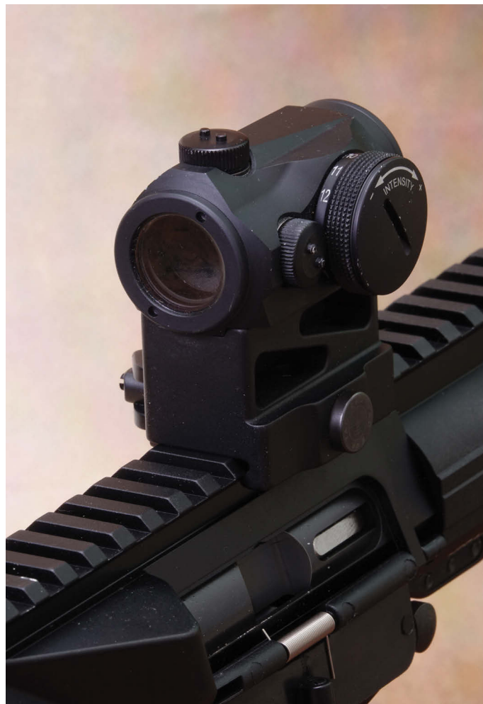
HERA Arms „The 9er Sport C“, ausgerüstet mit hochbauender Recknagel ERATAC-Blockmontage und Aimpoint Micro T-1-Leuchtpunktvisier.