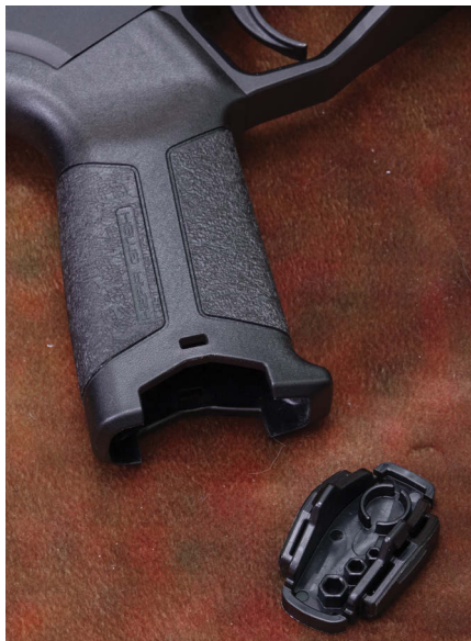
Der eigenständige, freistehende H15G-Pistolen-griff mit Hohlraum zum Verstauen von kleinen Utensilien.