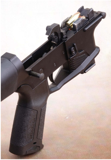
Der Karabiner wird mit modifizierten, auf 10 Patronen begrenzten Stahlblechmagazinen der UZI-Maschinenpistole gefüttert.