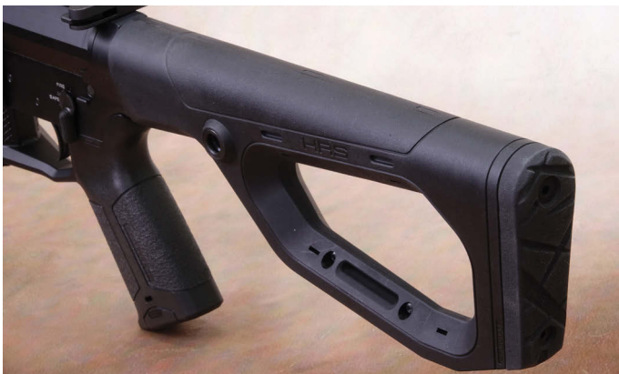
Die feste Schulterstütze Modell HRS (HERA Rifle Stock) ist gesetzlich vorgeschrieben. Im Durchbruch können bei Bedarf Deckplatten eingesetzt werden. Der HRS-Schaft besitzt Schnittstellen für Schnellwechsel-Riemenbügel zur Befestigung eines Trageriemens.