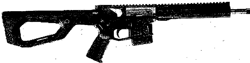
Abbildung 2: „The15th“ mit 11,5“ Lauflänge und Schulterstütze Modell „HRS“