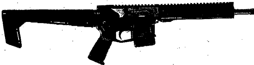
Abbildung 2: „The15th“ mit 11,5“ Lauflänge und Schulterstütze Modell HRS Light (Bild exemplarisch für alle o. g. Lauflängen)

sind von dem Verbot zur schießsportlichen Verwendung nach § 6 Absatz 1 Nummer 2 AWaffV nicht erfasst.